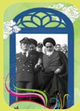
تلخیص از ویکی‌فقه (دانشنامه‌ی حوزوی) روز شمار انقلاب، میرزا باقر علیان‌نژاد، سوره مهر

ساعت ۹:۲۷ دقیقه روز ۱۲ بهمن ۱۳۵۷ بود که هواپیمای امام خمینی (ره) در فرودگاه مهرآباد به زمین نشست و ایشان پس از ۱۴ سال تبعید به وطن بازگشتند. ابتدا قرار بود که روز ۶ بهمن به کشور بازگردند، اما شاپور بختیار (نخست‌وزیر وقت) اعلام کرد که فرودگاه‌ها بسته‌اند و پروازی صورت نمی‌گیرد. ورود امام (ره) به تعویق افتاد و همین باعث اعتراضات و تظاهرات خونین شد. ایشان گفتند به محض باز شدن فرودگاه‌ها به کشور باز می‌گردند. روز نهم بهمن دولت بختیار شکست را پذیرفت و عقب‌نشینی کرد. اعلام کرد از امروز فرودگاه‌ها باز خواهد بود و هیچ معنی برای ورود امام (ره) به میهن وجود ندارد. فاصله ۱۲ تا ۲۲ بهمن (پیروزی انقلاب اسلامی)، با الهام گرفتن از آیه «والفجر، ولیال عشر» قرآن، ایام «دهه فجر» نامیده شد.