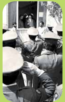
تلخیص از پایگاه اطلاع رسانی حوزه روز شمار انقلاب، میرزا باقر علیان‌نژاد، سوره مهر

نوزدهم بهمن ماه، ساعت ۱۰ صبح، صدها نفر از کارکنان نظامی نیروی هوایی، در حالی که لباس نظامی بر تن داشتند، به مدرسه رفاه رفتند و با امام دیدار کردند. در این مراسم ابراز وفاداری به امام به صورت رژه نظامی انجام گرفت. نیروها، در حالی که تصویرهایی از امام در دست داشتند و شعار می‌دادند: «ما قطره‌ای از ارتش تو هستیم خمینی»، با امام پیمان وفاداری بستند. این بیعت کارکنان نیروی هوایی ضربه خیلی سختی بر بدنه رژیم شاهنشاهی پهلوی بود که سقوط این رژیم را شتاب بخشید.